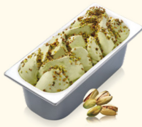
Pistazie mit Pistazienstückchen