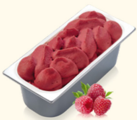
Sorbet Himbeer mit Himbeerstückchen