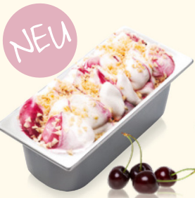
Amarena/ Spagnola mit Kirschsauce