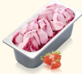
Erdbeer mit Erdbeersauce und -stückchen