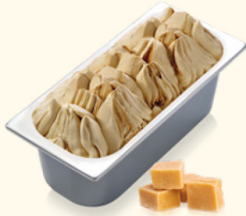
Dulce de Leche Milch Karamell mit Karamellsauce