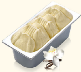
Vanille mit vermahlenden Vanilleschoten