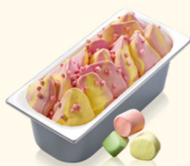
Bubble Gum Marshmallow mit Marshmallow-Stückchen