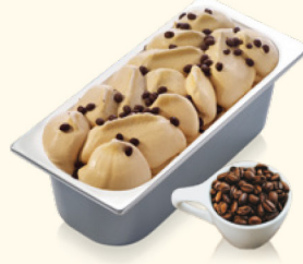
Café mit knusprigen Kaffeeschokobohnen