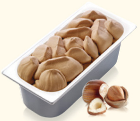
Haselnuss mit knackigen Haselnussstückchen