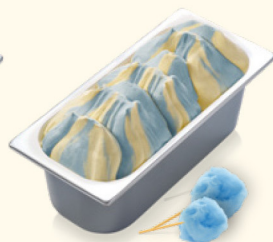
Blaue Zuckerwatte mit Zuckerwatte-Geschmack