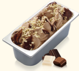
Triple Choc mit Schokoladensauce und weißen Schokostückchen