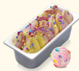
Konfetti- Erdbeere Erdbeereis und Eis mit Vanillegeschmack und glasierte Schokolinsen