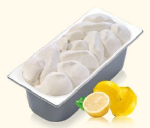
Sorbet Zitrone mit Zitronensaft