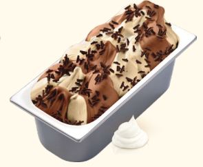
Baileys Cremiges Karamelleis mit süß-herbem Schlagobers- Whiskey Likör-Strudel