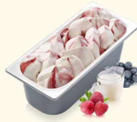
Joghurt- Waldfrucht mit Waldfruchtsauce