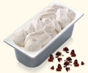
Stracciatella mit zartschmelzenden Milchschokoladenstückchen