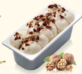
Walnuss mit Walnussstückchen