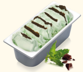
Minz Crunch mit knackiger Knusperschicht