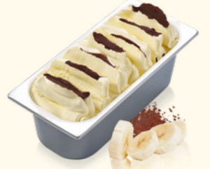
Banana Crunch mit Knusperschichten