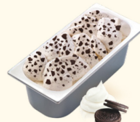
Cookies & Cream Cremiges Eis mit Obersgeschmack und vielen saftigen Keksstückchen